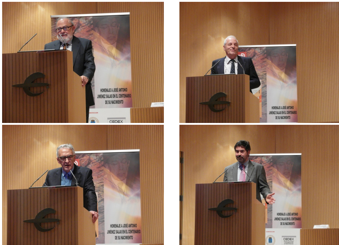
Algunos de los participantes en las intervenciones