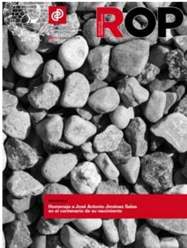
Número monográfico de la Revista de Obras Públicas dedicado íntegramente al homenaje a Jiménez Salas en el centenario de su nacimiento.