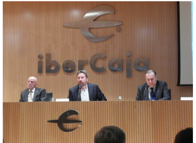
Acto de clausura