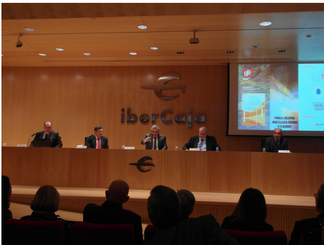
Acto de inauguración de la Jornada

Las intervenciones y comunicaciones fueron desarrolladas por más de una docena de intervinientes entre los que se encontraban los más destacados catedráticos, profesores y profesionales del mundo de la geotecnia española, con una gran carga de emoción, respeto y admiración a tan ilustre y querida personalidad sin duda irrepetible.